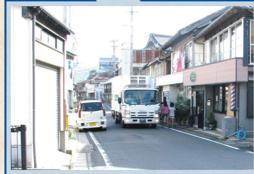
車道幅員狭少による離合困難