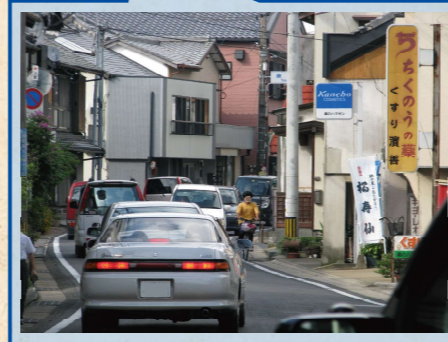
歩道が無い歩行者が危険