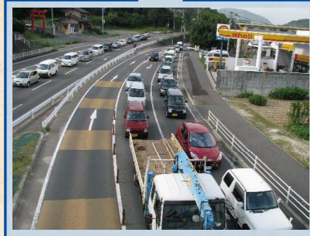
朝夕の通勤時の渋滞状況